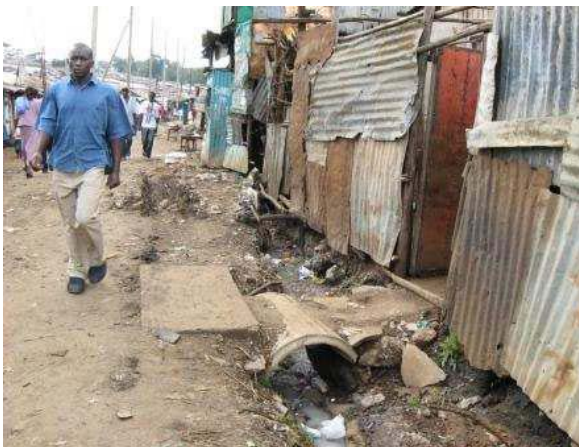
Slum in Kibera

Der Abschied von den Kids ist mir sehr schwer gefallen. Ich wäre gerne noch bei ihnen geblieben.