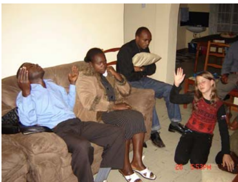
Ministry beim Home-Meeting

Den Abschluss unserer Missionsreise bildete ein Einsatz in einer kleinen Gemeinde, die sich, wie eine Oase, mitten im Slum von Kibera in Nairobi befindet.