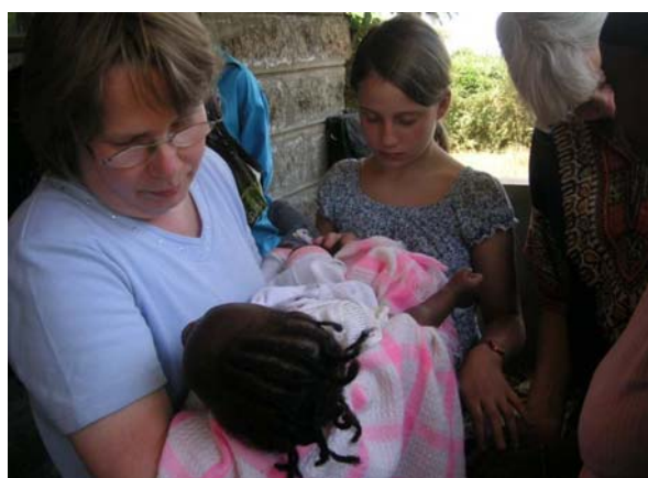
Gebet für ein krankes Mädchen