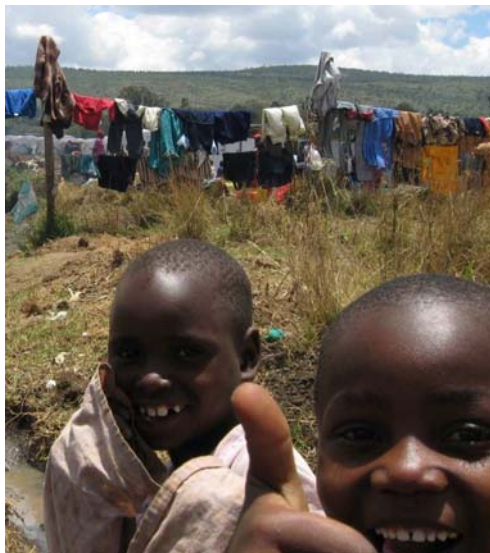
Kenianische Flüchtlinge in Nakuru

Ich habe sehr viel Freude bei den Einsätzen und den Begegnungen mit den unterschiedlichsten Menschen gehabt. Tief in meinem Herzen war aber noch der Traum, die Worte „Deine Arme sind ja gar nicht lang genug, um all die Kinder an dein Herz zu drücken.“ Okay, ich habe viele Frauen, sozusagen große Kinder Gottes, an mein Herz gedrückt und durfte mit dazu beitragen, dass etwas in ihnen heil wird. Aber wenn ich ehrlich sein soll, habe ich noch auf die kleineren Kinder gewartet.