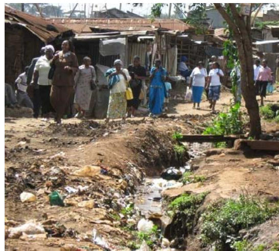
Slum in Kibera

Den Abschluss unserer Missionsreise bildete ein Einsatz in einer kleinen Gemeinde, die sich, wie eine Oase, mitten im Slum von Kibera in Nairobi befindet.