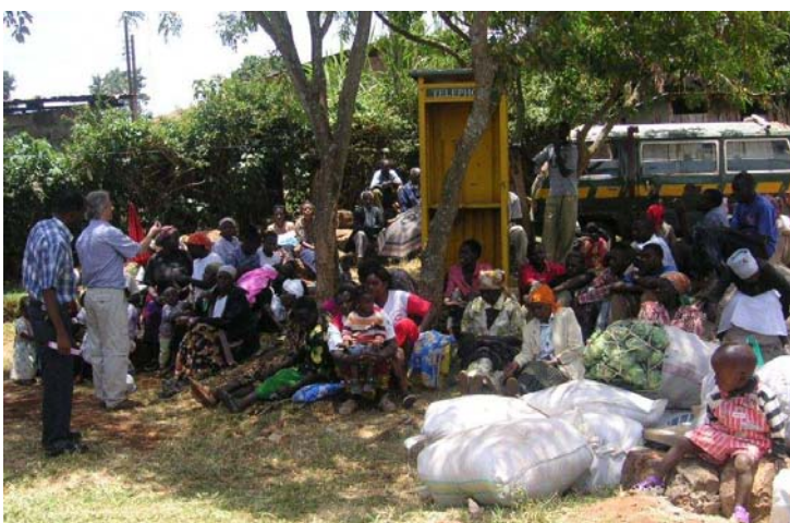
Einsatz - kenianische Flüchtlinge