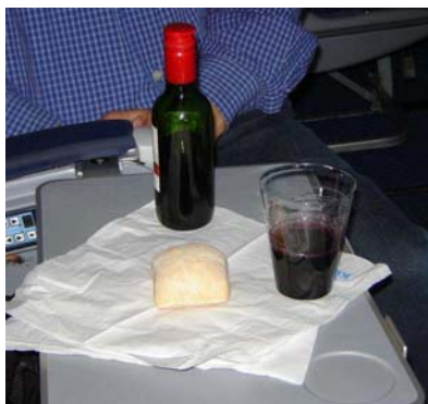
Wir feiern Abendmahl in 11.000 m Höhe über dem Sudan